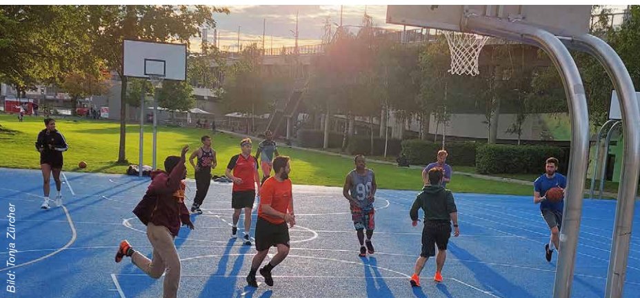
Die Dreirosenanlage würde zehn Jahre lang zur Grossbaustelle.

Es ist an der Zeit, aus den Fehlern der Vergangenheit zu lernen und nachhaltige Alternativen zu fördern. Mit den 2,6 Milliarden Franken, die der Rheintunnel kosten würde, könnten beispielsweise 26 Tramlinien gebaut werden. Das ist mehr als genug, um Pendler*innen aus Frankreich, Deutschland und den umliegenden Kantonen klimafreundlich und staufrei zu ihrem Arbeitsplatz zu bringen. ■