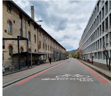
Abbildung 6: Veloschnellrouten Winterthur