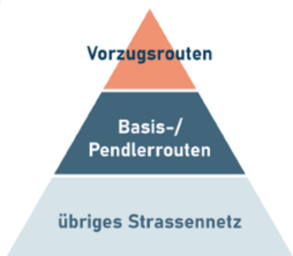
Abbildung 2: Aktuelle Übersicht der Netzhierarchie und Begrifflichkeiten seitens Bund und Kanton

Aus diesem Grund möchte der Regierungsrat das kantonale Veloroutennetz neu um Velovorzugsrouten als übergeordnete und damit wichtigste Netzhierarchie ergänzen. Diese Absicht hat er in der Mobilitätsstrategie festgehalten. Im Agglomerationsprogramm der 4. Generation hat der Kanton Basel-Stadt seine Netzplanungen bereits in diesem Sinne mit denjenigen der Nachbarkantone und -länder abgestimmt. Sowohl der Kanton Basel-Landschaft als auch der Landkreis Lörrach treiben die Planung von Velovorzugsrouten bzw. -schnellrouten voran.