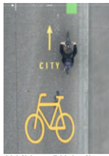
Abbildung 5: Velopiktogramm Zürich