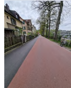
Abbildung 7: Roteinfärbung Belag Winterthur

Diese Beispiele zeigen, dass es schweizweit keine einheitliche Handhabung zur Kennzeichnung der wichtigsten Netzhierarchie «Velovorzugsroute» gibt. Im Rahmen der Beantwortung des Postulats Burkart betreffend Verkehrsfläche für den Langsamverkehr hat der Bundesrat darauf hingewiesen, dass er eine umfassende Einfärbung von Radverkehrsflächen auf ihre Wirkung prüfen wird.