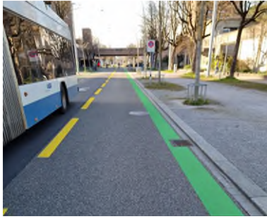
Abbildung 4: Vorzugsrouten Zürich