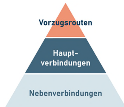
Abbildung 3: Zielbild Netzhierarchie kantonales Veloroutennetz 2

Künftig soll auf die Unterscheidung von Pendler- und Basisrouten verzichtet werden. Neben den Velovorzugsrouten werden Haupt- und Nebenverbindungen ausgewiesen. Diese Struktur entspricht den Empfehlungen des Bundes. Gemäss dem Bundesgesetz über Velowege müssen die angepassten Pläne bis 2027 in den entsprechenden Richt-/Teilrichtplänen verankert sein. Der Regierungsrat wird zu gegebener Zeit einen aktualisierten Teilrichtplan Velo vorlegen.