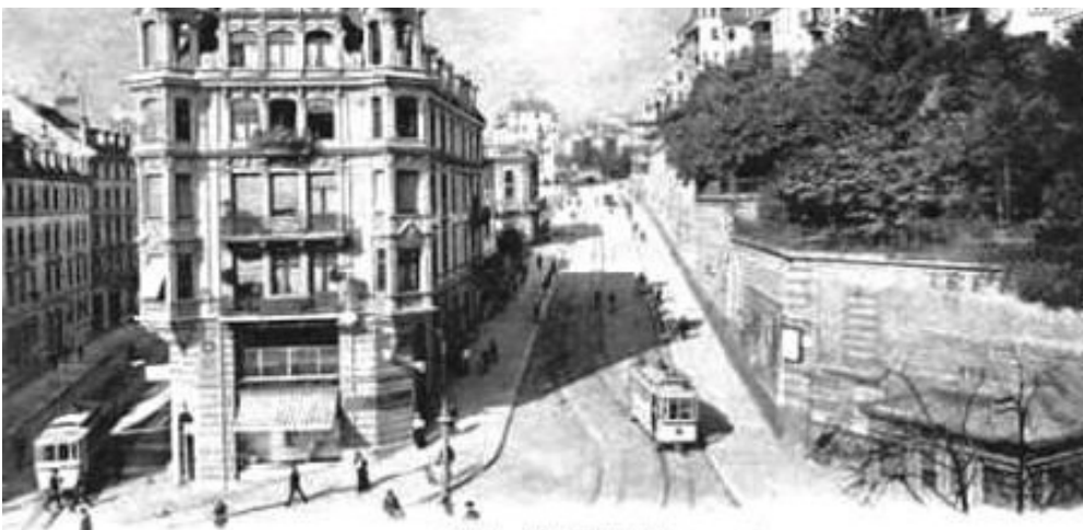
Weinbergstrasse um das Jahr 1910 , Quelle: Altzürich