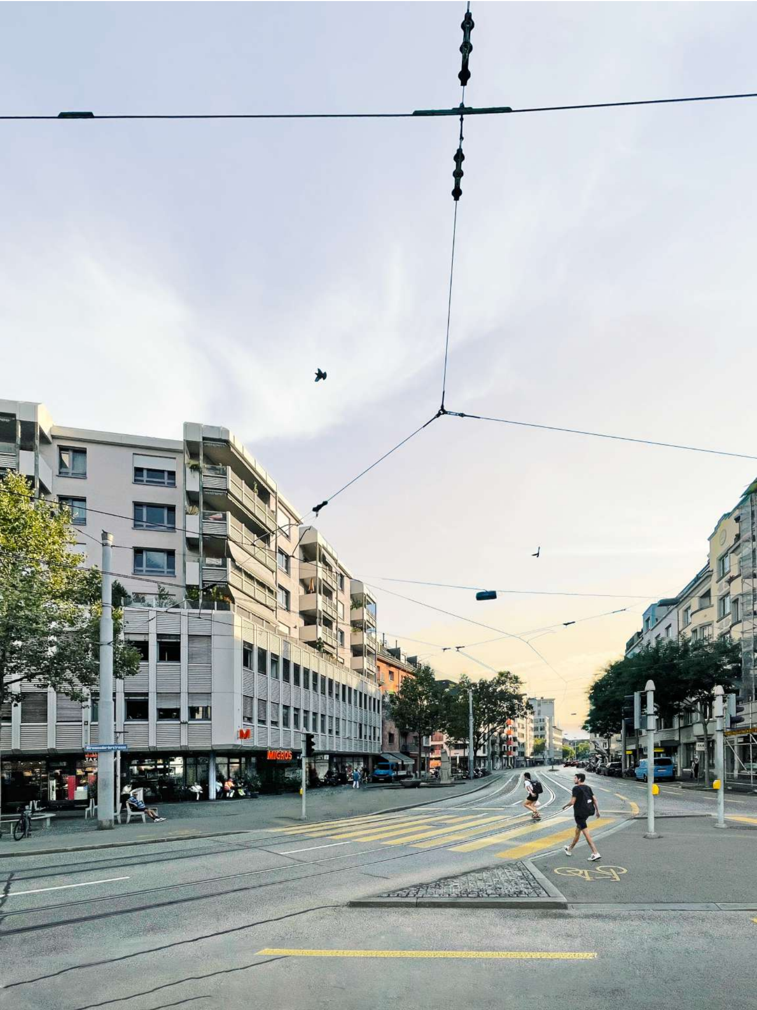
Schmiede Wiedikon: Heute