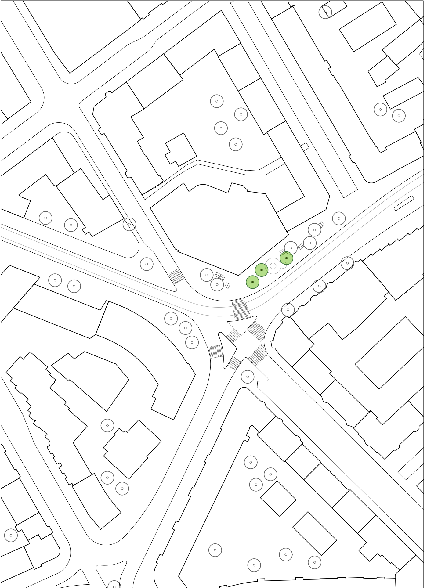
Schmiede Wiedikon in Zukunft