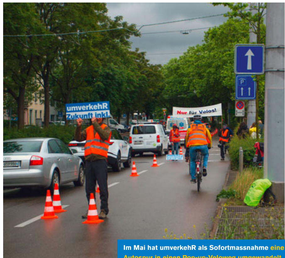
Im Mai hat umverkehrR als Sofortmassnahme eine Autospur in einen Pop-up-Veloweg umgewandelt.