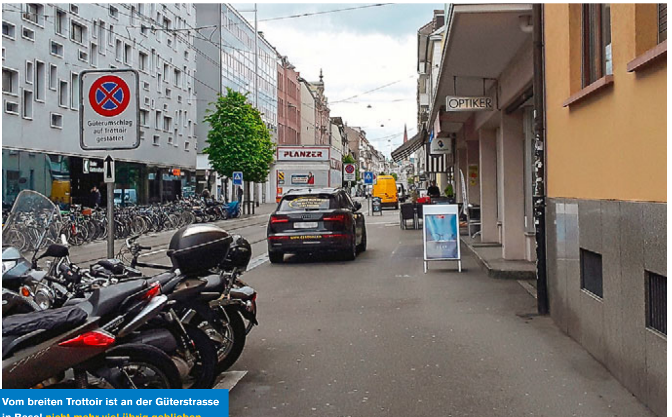
Vom breiten Trottoir ist an der Güterstrasse in Basel nicht mehr viel übrig geblieben.

zona, Bern, Biel, Chur, Genf, Lausanne, Locarno, Lugano, Luzern, Neuenburg, St. Gallen, Winterthur, Zug und Zürich detailliert untersucht. Die Fussgängerfreundlichkeit wurde in den drei Teilprojekten Fussverkehrstest, Planungspraxis und Umfrage zur Zufriedenheit erhoben. Der Fussverkehrstest fokussiert sich auf die Infrastruktur, die für den Fussverkehr bereitgestellt wird. Dabei handelt es sich um eine Qualitätsbewertung mittels einer GIS-App nach einem zuvor festgelegten Kriterienkatalog. Das zweite Paket im Städtevergleich umfasst unter dem Titel «Planungspraxis» eine Auswertung darüber, wie in der jeweiligen Stadtverwaltung und in der Stadtpolitik mit dem Thema Fussverkehr umgegangen wird. In einem dritten Projektteil wird – vergleichbar mit dem «PRIX Velostädte» von Pro Velo – in Form einer Online-Umfrage die Zufrie-