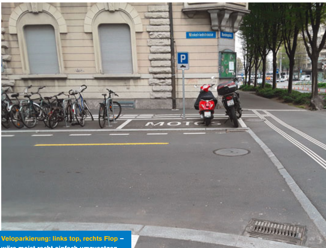
Veloparkierung: links top, rechts Flop – wäre meist recht einfach umzusetzen.

Das Projekt GEHsund zeigt nebst den Empfehlungen für die 16 untersuch-